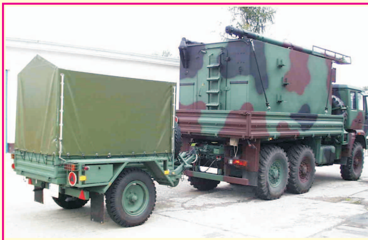
Widok AWRS w wersji kontenerowej

Aparatownia Wielokanałowego Radiodostępu Simpleksowego (AWRS) przeznaczona jest do sprzężenia sieci łączności radiowej UKF (SLR) pola walki z systemem łączności radioliniowo-przewodowej (SŁRP) STORCZYK